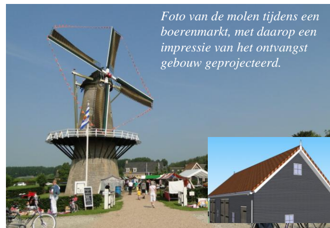
Foto van de molen tijdens een boerenmarkt, met daarop een impressie van het ontvangst gebouw geprojecteerd.

streekproducten, de toeristische dienstverlening als bijvoorbeeld