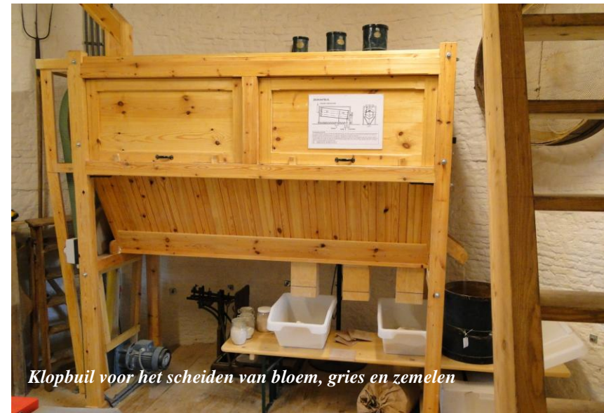
Klopbuil voor het scheiden van bloem, gries en zemelen

ontvangen kunnen worden. Dit ontvangstgebouw zal tevens een belangrijke functie als pleisterplaats moeten vervullen bij de realisering van een zogenaamd Toeristisch OverstapPunt Voor de bemensing van het TOP zou samenwerking gezocht kunnen worden met de Vereniging Psyient Nederland, waarvan de medewerkers nu reeds met onze stichting samenwerken bij het verpakken van de molenproducten voor de verkoop aan particulieren en