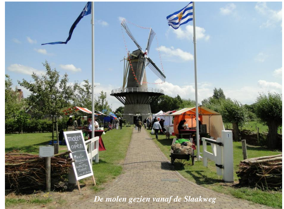
De molen gezien vanaf de Slaakweg