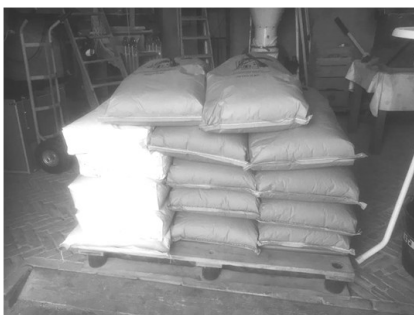
Een nieuwe voorraad (375 kg) graan om te malen

Wel fijn was dat de meelverkoop gewoon doorgang vond, hoewel de omzet terugliep. In 2020 maalden we ca. 1100 kg, In 2021 met de eerste lockdown werd dat ca. 2100 kg. Maar afgelopen jaar nam die productie weer af tot 1500 kg. Er werd nu geen meel en gist meer gehamsterd.